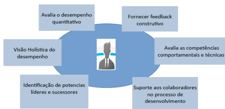
Figura 2: feedback 360

“A avaliação 360 graus é uma ferramenta essencial para a gestão por competência, pois permite a visão holística do desempenho dos colaboradores, englobando diversas perspectivas e esperanças para o desenvolvimento individual e organizacional” (Dutra, Atlas 2014).