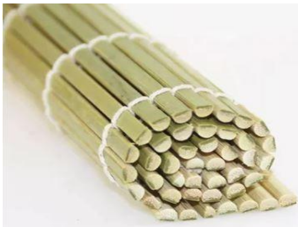
Imagem 2 – Material para desenrolar

(I) Desenrolar : Para realizar esta atividade, daremos à criança um rolo individual de bambu, semelhante ao utilizado pelos cozinheiros para fazer sushi. O objetivo é que a criança a enrole e desenrole, algo que reforce os seus dedos e as suas capacidades de coordenação.;