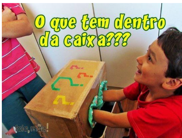
Imagem 7 – Atividade da caixa.

Como sugestão de brincadeira, sugere-se a brincadeira das duas caixas: Na caixa de número um há peças de fantasias, vestidos ou capas que poderão ser confeccionados com materiais recicláveis. Na caixa dois haverá acessórios, chapéus, coroas, óculos e máscaras. Deverá existir também um bloco de cartas com desenhos de brincadeiras, por exemplo: escolinha, casinha, bombeiro e heróis. A criança deverá escolher alguma peça de fantasia da caixa um e em seguida tirar um acessório da caixa dois. Por último retirar uma carta do bloco. Exemplo disso: a criança retirou um vestido da caixa um, uma coroa da caixa dois e a brincadeira escolinha na carta. A aluna deverá então utilizar a imaginação para brincar de escolinha, vestida de princesa ou do que ela imaginar que a junção das duas caixas deva gerar.