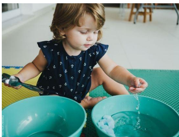
Imagem 3 – Atividade com água e esponja

(II) Água e esponja : Esta é uma atividade prática que estimula os sentidos. A criança terá de espremer água de um recipiente para outro utilizando uma esponja. Para evitar que se molhem, podemos também dar-lhes um guardanapo para limparem quaisquer salpicos.