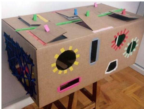
Imagem 5 – Caixa sensorial