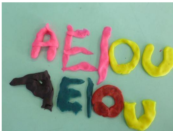
Imagem 4 – Massinha caseira