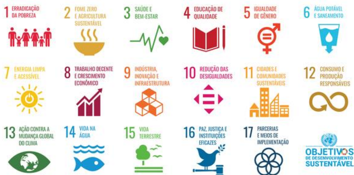
Figura 04 - 17 Objetivos da ODS

problemas ambientais, sociais, econômicos e políticos. Eles fazem parte da agenda 2030 para o desenvolvimento sustentável. São 17 objetivos com metas específicas para orientar ações globais em direção a um mundo mais justo, inclusivo e sustentável.