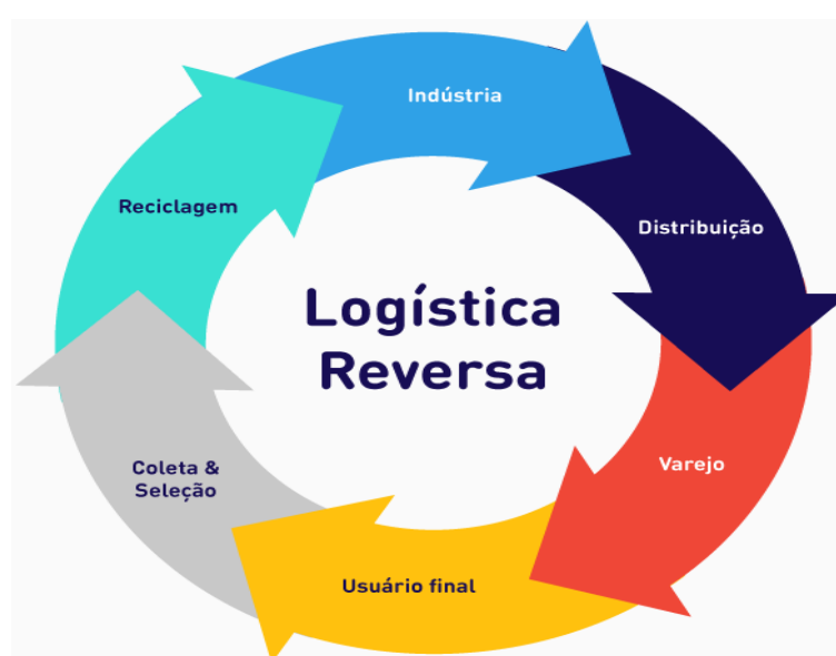
Figura 03 - Ciclo da logística reversa