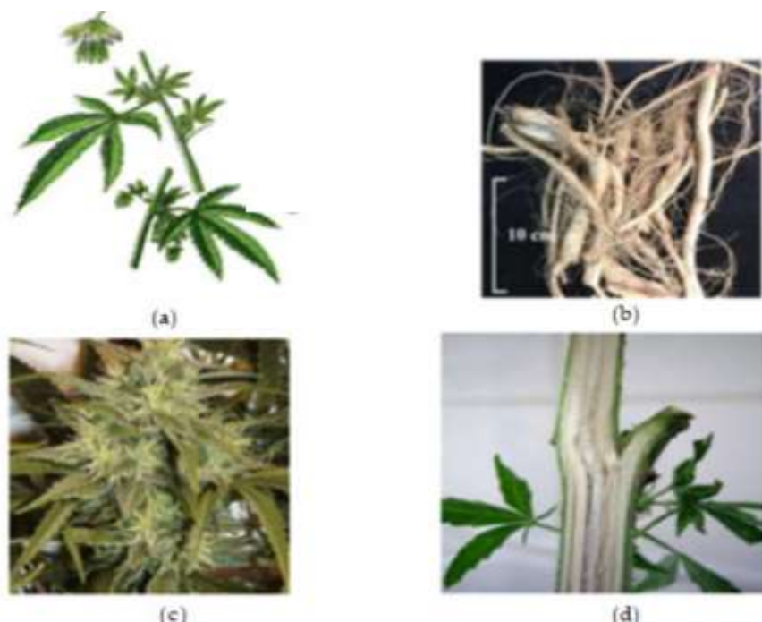
(a) Partes de floração de Cannabis sativa masculina e feminina com folhas e sementes frescas. (b) Raiz de Cannabis sativa fresca. (c) Inflorescência fresca de Cannabis sativa (flor). (d) Caule da Cannabis sativa .

A Cannabis sativa , como fitoterápico, é uma mistura complexa de compostos, incluindo fenóis canabinoides, fenóis não canabinoides (estilbenoides, lignanas, espiro-indanos e dihidrofenantrenos), flavonoides, terpenoides, álcoois, aldeídos, n-