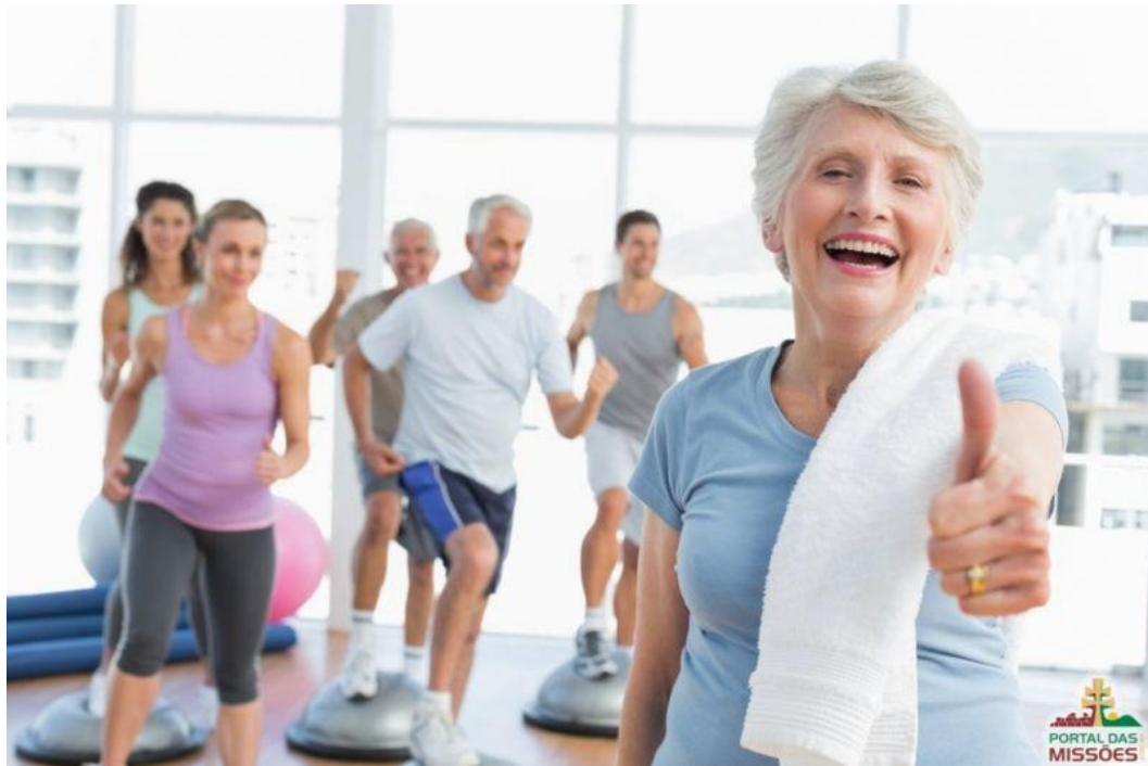
Figura 5 – Atividade Física e Saúde mental.

as crianças a apresentar modelos de comportamento e que sigam fisicamente em atividade com o decorrer da idade. Proporcionar que as instalações de prática esportiva e de lazer ofereça chance para que todos tenham acesso a prática esportiva (OMS, 2014).