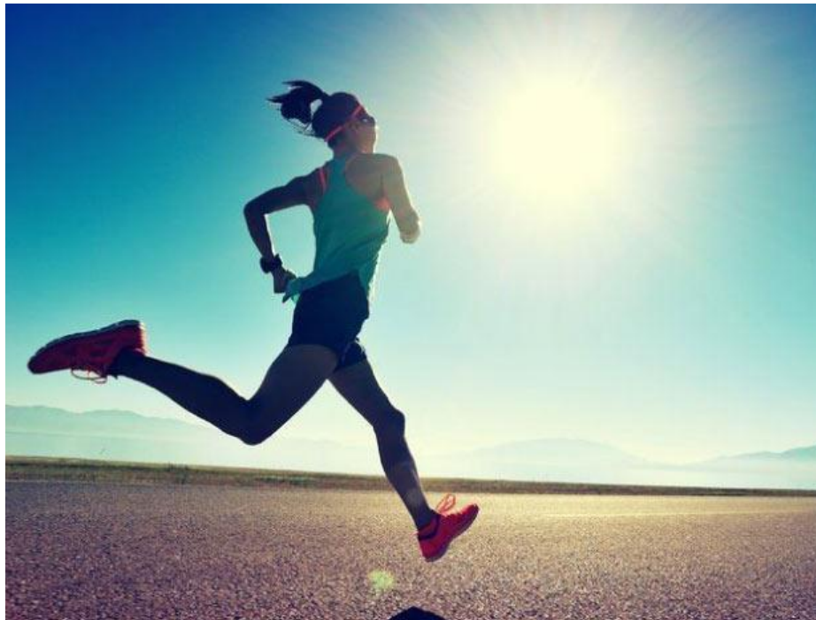
Figura 6 - Performance Esportiva.

Rodrigues (2018) Concluiu que no transtorno da ansiedade, nem todos os pacientes aceitam transformação ou nova adaptação em algumas reações fisiológicas e as atividades físicas com intensidade superior ao limite do ácido láctico devem ser abolidos, bem como o treinamento com intervalos, pois concorre para o aumento do ácido láctico no nível sanguíneo.