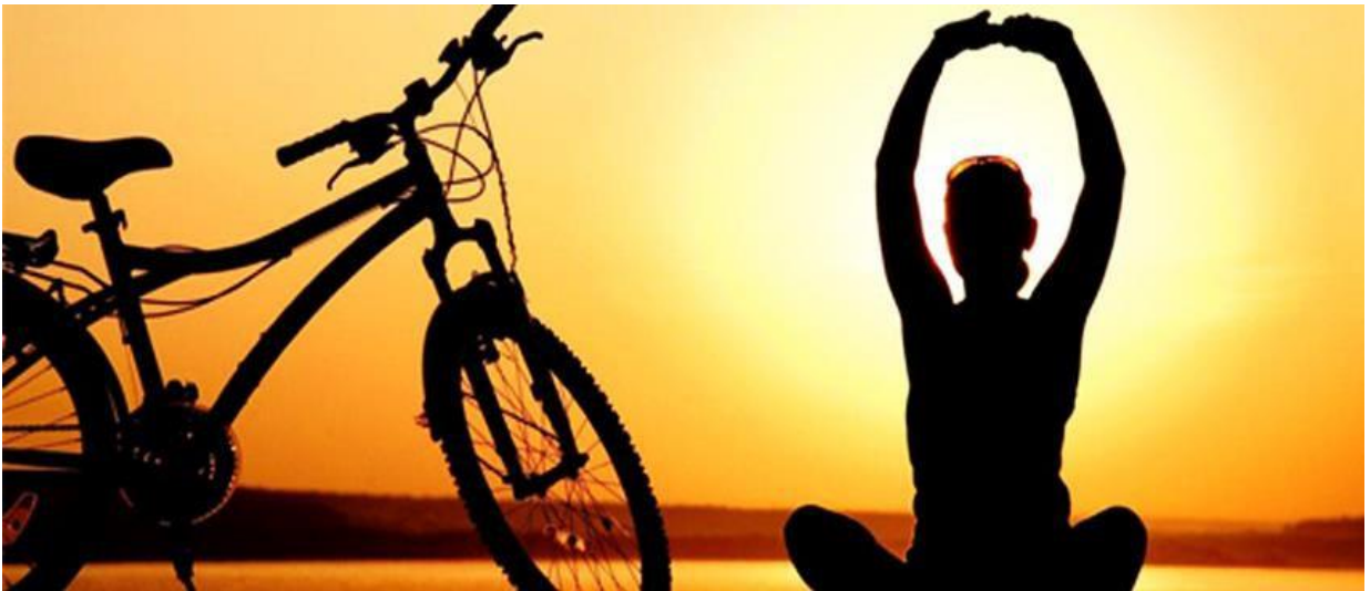
Figura 4 – Atividade Física é um aliado à Saúde Mental.