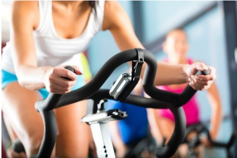
Figura 7 – Tua saúde.