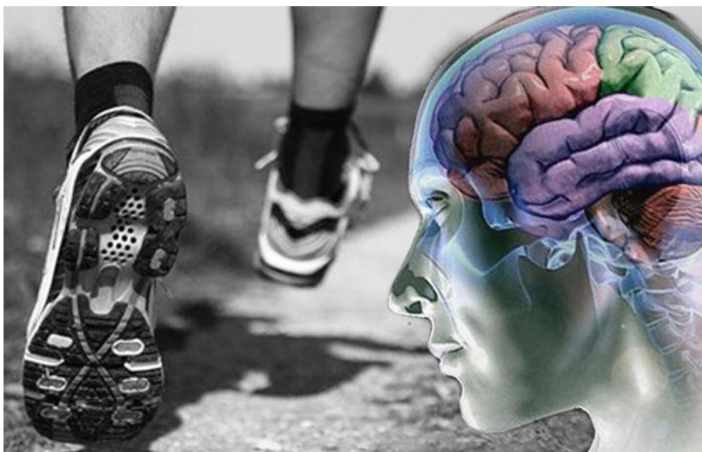
Figura 1 - Benefícios para saúde mental com Atividade Física.

Ao observar o crescente número de pessoas que apresentam quadros de transtorno de ansiedade, principalmente no período pós-pandemia da COVID 19, notou-se a viabilidade de elaborar um projeto de pesquisa com ênfase na crescente quantidade de pessoas com transtorno. As vantagens da prática de atividade física, são enfatizadas por meio da diminuição dos quadros de ansiedade, a ascensão da autoconfiança beneficiando e incentivando as transformações de velhos hábitos cotidianos em pessoas com indícios de transtorno psicológico (BLUMENTHAL, et al, 1999, DALLEY, et al, 2008)