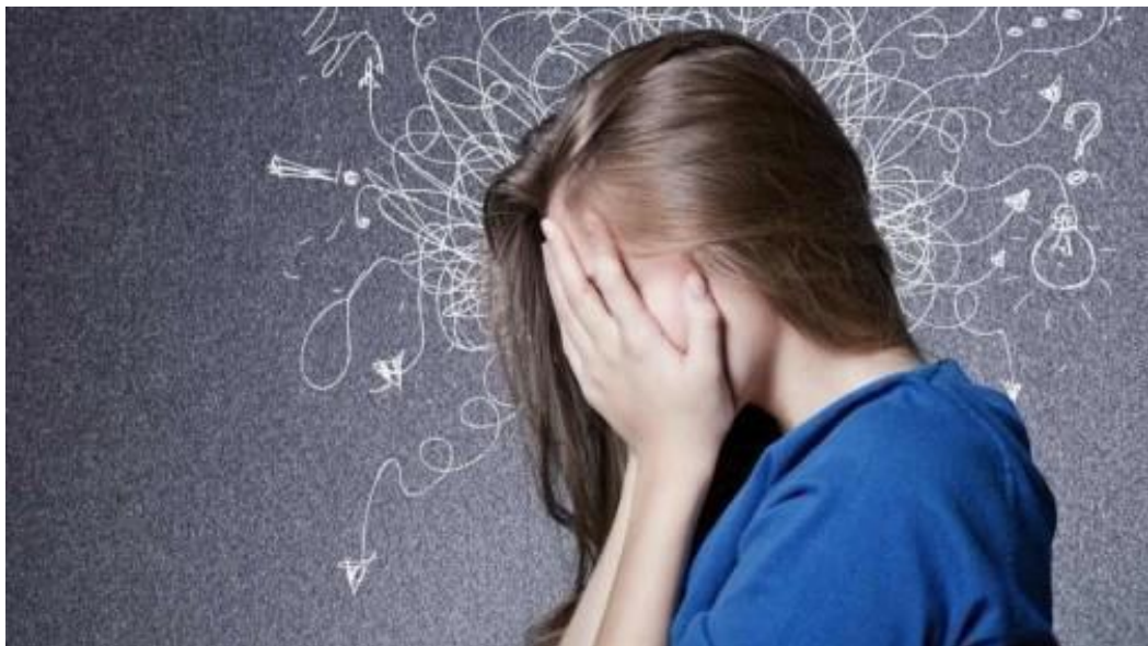
Figura 3 – Ansiedade.

A ansiedade é um sentimento vago e desagradável de medo, apreensão, caracterizado por tensão ou desconforto derivado de antecipação de algo desconhecido ou estranho. Os transtornos ansiosos são quadros clínicos em que esses sintomas são primários, ou seja, não são derivados de outras condições psiquiátricas (depressão, psicose, transtorno do desenvolvimento, transtorno hiperkinético e entre outros) (ANA REGINA,2000).