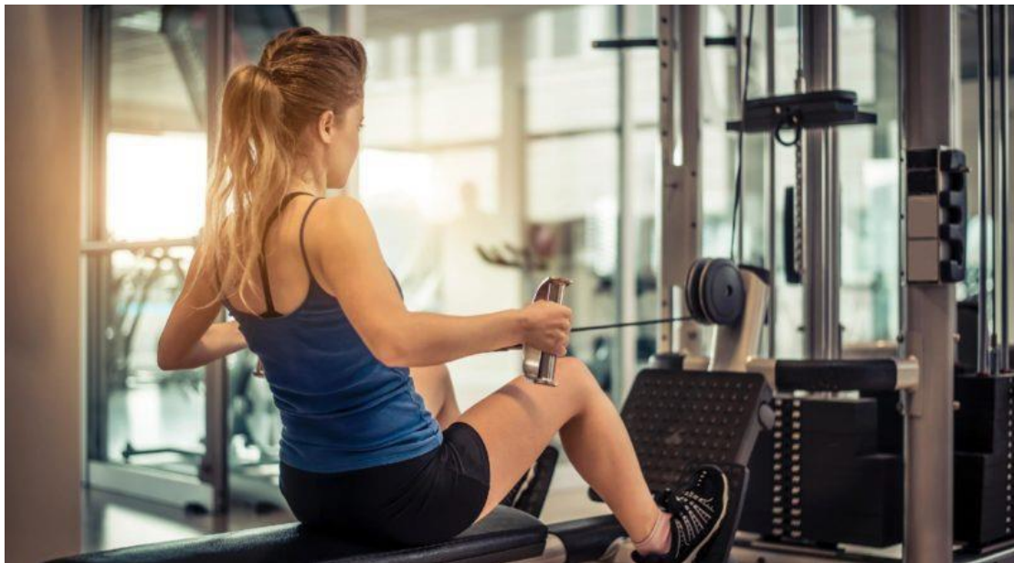
Figura 10 - Musculação.

Sendo assim, as atividades físicas praticadas efetivamente, tende a gerar bem estar idêntico ao medicamento antidepressivo e ansiolítico e ainda protege dos transtornos físicos e mentais. Muitos pesquisadores que abraçam esse tema e fazem estudo com adultos, com as características psicobiológicas mostraram resultados satisfatórios diante a prática da atividade física e frente a saúde pública em situações estressantes de medo, que tendem a ferir transtorno de ansiedade. Vários fatores ambientais diretamente relacionada a vida urbana tendem a desestimular o crescimento da atividade nas pessoas, baixa qualidade das calçadas, falta de parques, falta de instalações para o esporte e o lazer, poluição e tráfego intenso.