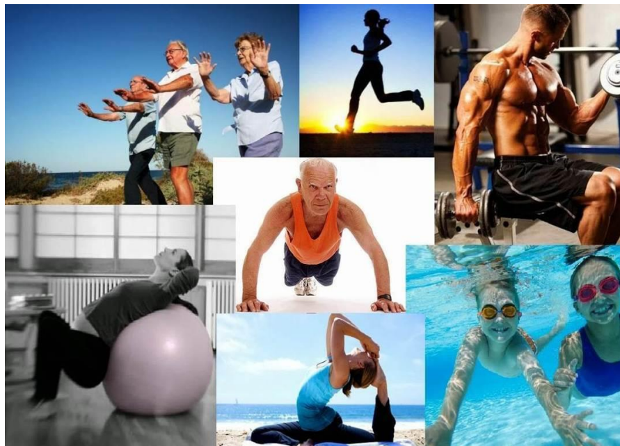
Figura 9 - Qual tipo de atividade ideal para sua necessidade?

O tema procurou esclarecer a seguinte questão: A prática sistematizada da Atividade Física pode servir como auxiliar e ferramenta no controle e amenização da ansiedade? Os estudos analisados mostraram sinal positivo quanto ao êxito da Atividade física ocasionar melhoras sensíveis nos sintomas de ansiedade.