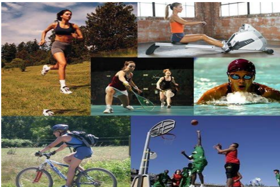
Figura 2 - Atividade Física.

A OMS define atividade física como sendo qualquer movimento corporal produzido pelos músculos esquelético que requeiram gasto de energia, incluindo atividades físicas praticadas durante o trabalho, jogar, execução de tarefas, viagens e em atividades de lazer. A atividade física de intensidade moderada como: Caminhar, pedalar, praticar esportes em geral, traz benefícios significativos para saúde. Reduzem o risco de hipertensão, doenças cardíacas coronária, AVC, diabetes, câncer do cólon e mamas, depressão e ansiedade (OMS;2014).