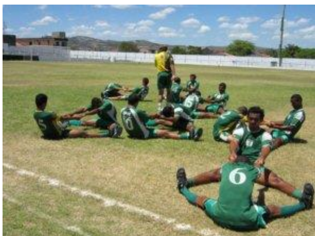
Figura 3: Exercício de flexibilidade