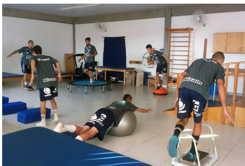
Figura 2: Treino de proprioceptivo e equilíbrio