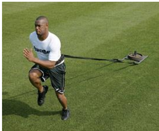
Figura 1: Treinamento de força