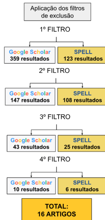
Figura 2 - Aplicação do filtro de exclusão