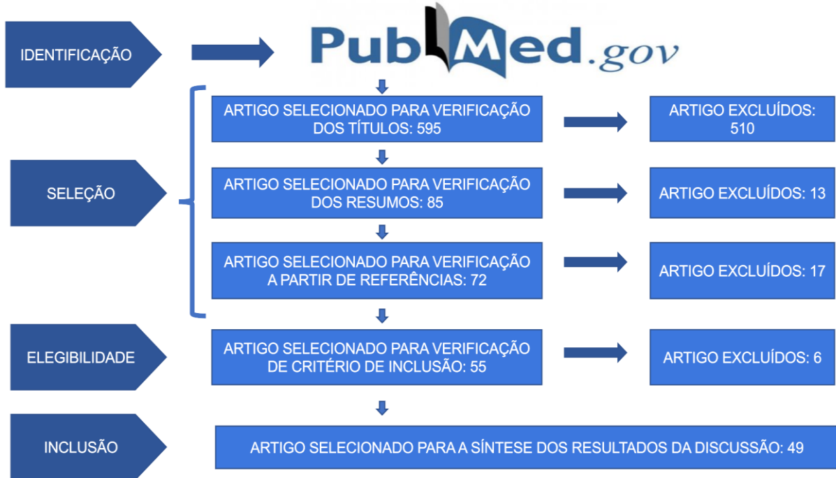
Figura 1: fluxograma de referências